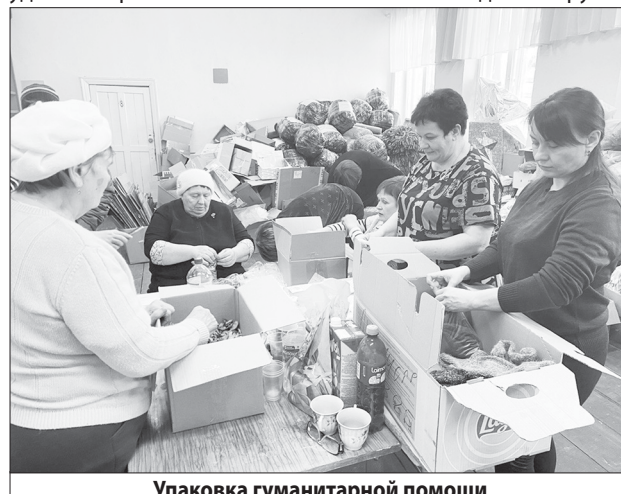
Упаковка гуманитарной помощи