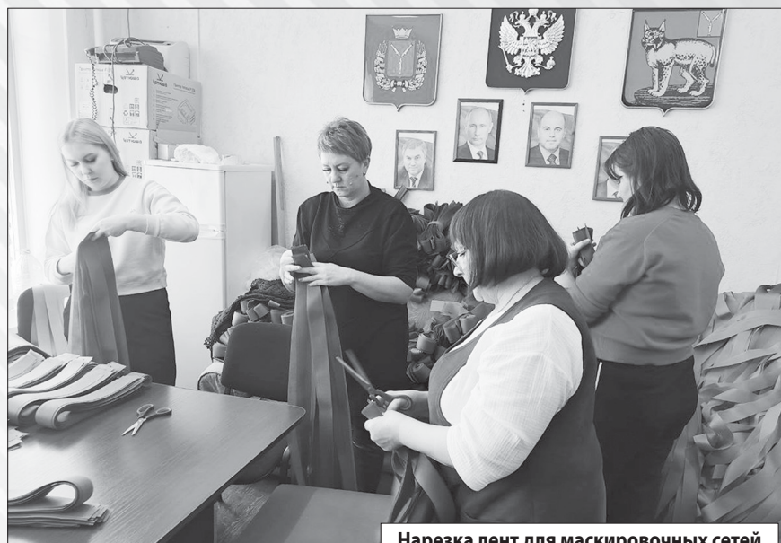
Нарезка лент для маскировочных сетей

Мастерская по нарезке лент для маскировочных сетей работает на полную мощность