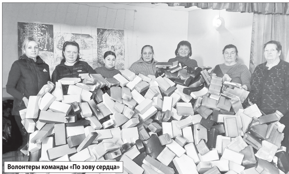
Волонтеры команды «По зову сердца»

Продолжающаяся специальная военная операция требует от нас неустанной поддержки наших военнослужащих, находящихся на передовой. С каждым днем спектр необходимой помощи расширяется, и мы обязаны преодолевать любые препятствия, чтобы обеспечить их всем необходимым. Пока наши сыновья, братья, мужья и отцы защищают нас там, мы будем помогать им в тылу, вкладывая в эту помощь всю свою душу.