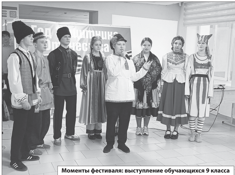
Моменты фестиваля: выступление обучающихся 9 класса

В Турках стартовал Фестиваль «Радуга культур»: Встреча поколений и яркие традиции