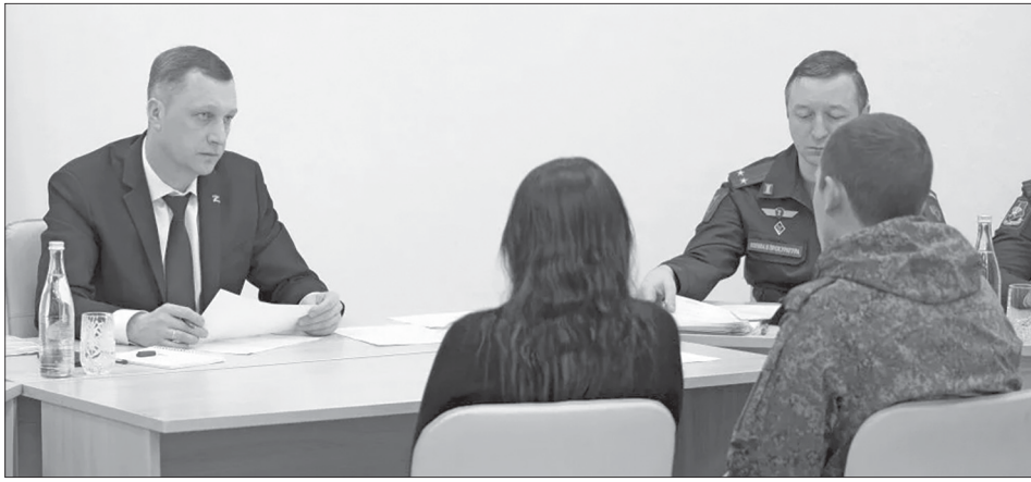
Губернатор Роман Бусаргин провел ежемесячный личный прием участников СВО и членов их семей.

С различными вопросами к главе региона обратились около 30 человек. Каждый вопрос взят на контроль, к решению будут подключены все профильные ведомства.