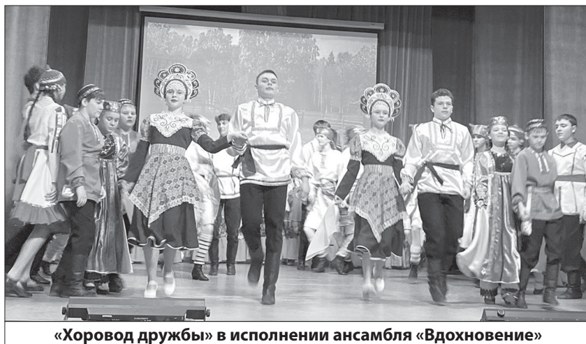
«Хоровод дружбы» в исполнении ансамбля «Вдохновение»

Ведущие мероприятия не обошли стороной тему сохранения культурного наследия. Они акцентировали внимание на важности бережного