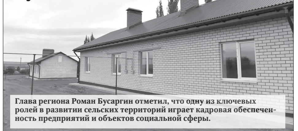
Глава региона Роман Бусаргин отметил, что одну из ключевых ролей в развитии сельских территорий играет кадровая обеспеченность предприятий и объектов социальной сферы.

В вопросе привлечения и сохранения квалифицированных специалистов в районах области базовое значение имеет наличие служебного жилья. Для этого задействуются все имеющиеся механизмы, главным из них стала федеральная программа «Комплексное развитие сельских территорий».