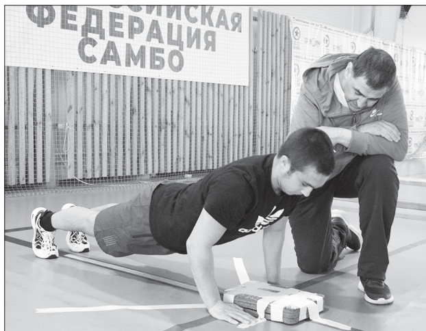
Лучшее выполнение отжиманий на фестивале

В ФОКе «Молодёжный» в понедельник было шумно. В рамках содействия развитию движения ГТО здесь прошёл муниципальный этап Фестиваля Всероссийского физкультурно-спортивного комплекса «Готов к труду и