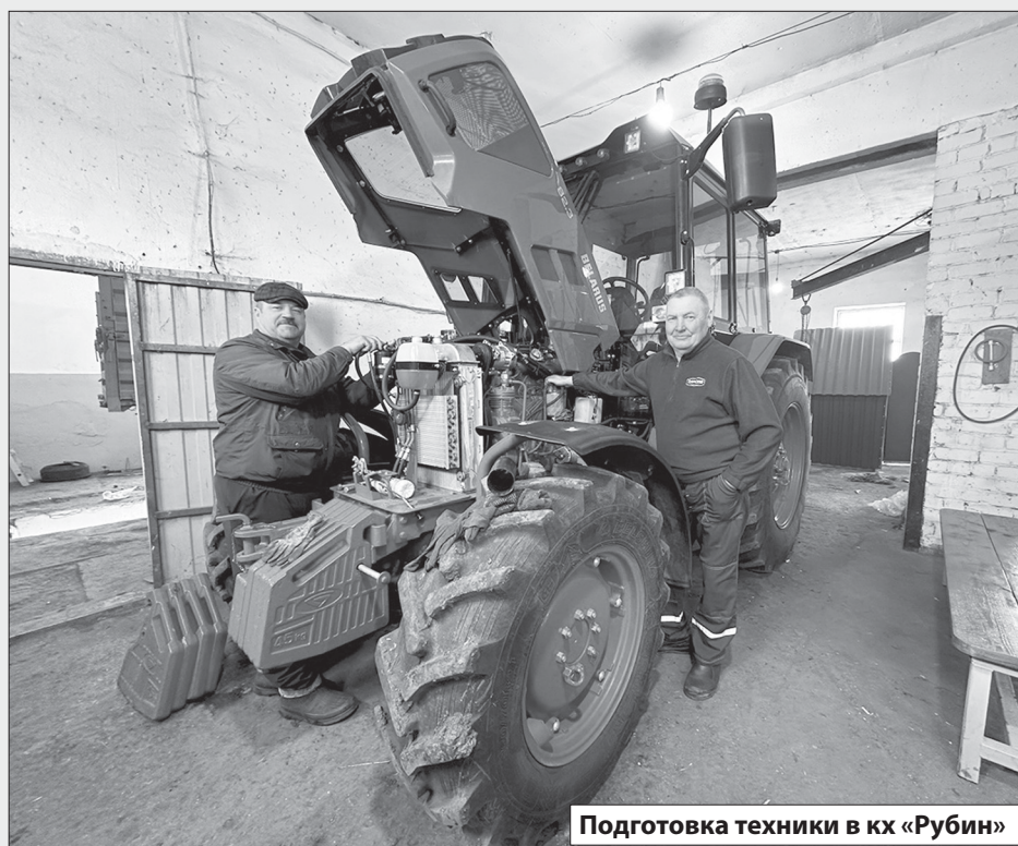
Подготовка техники в кх «Рубин»

Весна уже полностью вступила в свои права. С каждым днём всё сильнее согревает солнце. Снег с полей практически полностью сошел. Для успешного старта нового сезона сельскохозяйственные организации Турковского района ведут активную подготовительную работу.