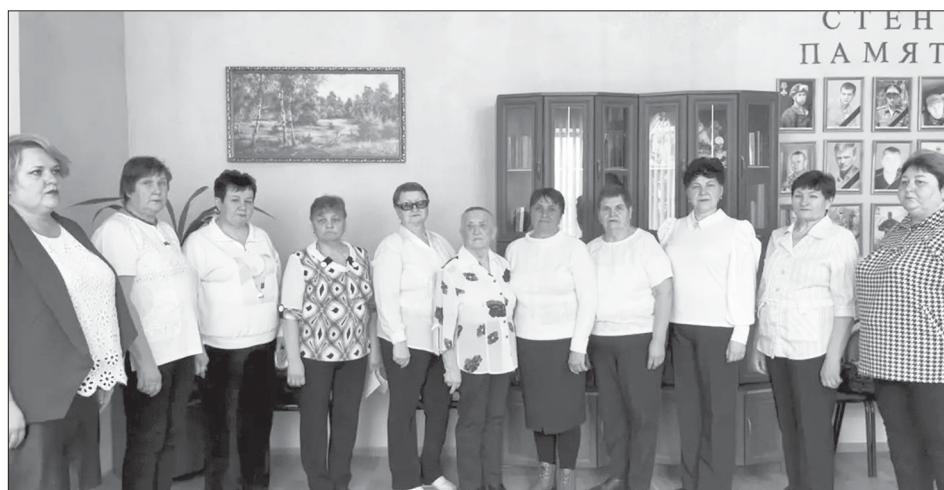
Ансамбль «Отрада» ГАУ КЦСОН

Со 2 февраля по 28 марта 2026 года в России прошёл III Всероссийский многожанровый конкурс-фестиваль «Водопад искусств». Организатором этого масштабного события выступило творческое объединение «Водевиль талантов». Фестиваль стал не просто соревнованием, а настоящим праздником для одарённых людей всех возрастов, проявляющих себя в вокале, хореографии, изобразительном искусстве и других творческих направлениях.