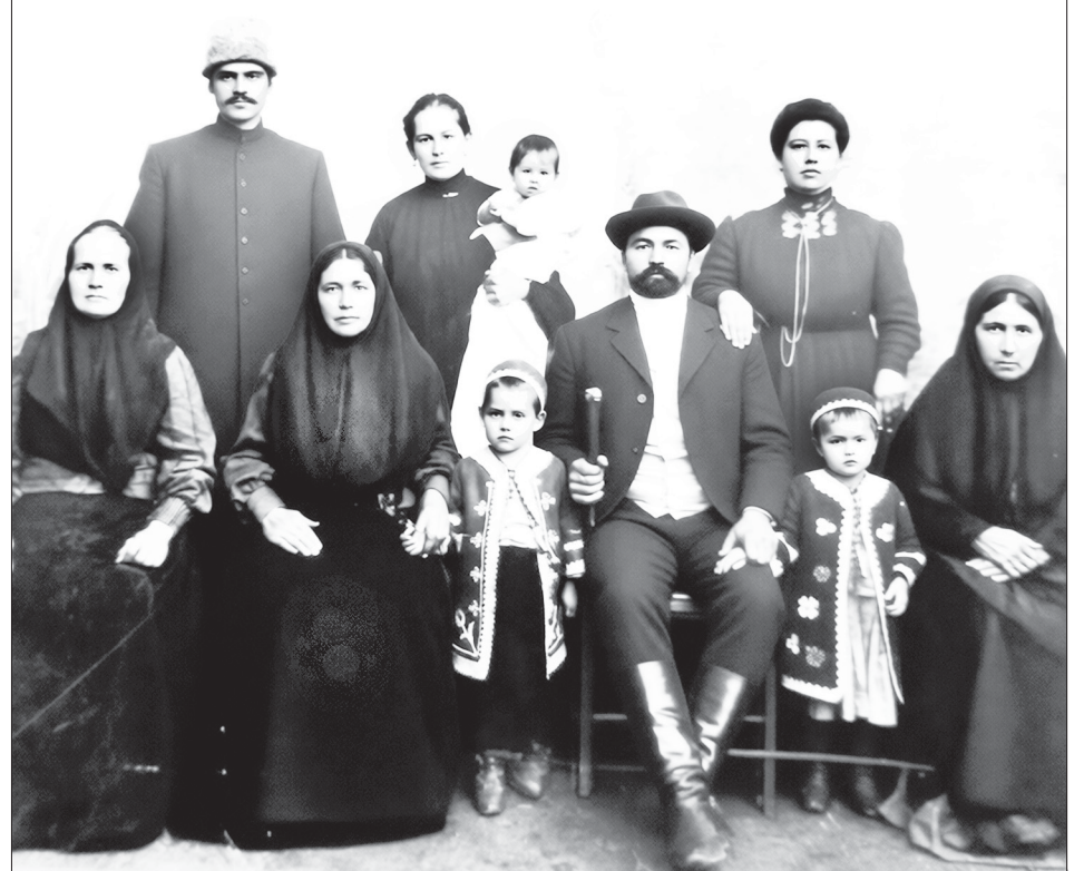
Фото конца XIX в. хранит память о людях разных кровей, собравшихся вместе (с. Чириково)

Чтобы наш район стал таким, каким мы его знаем, вклад внесли представители