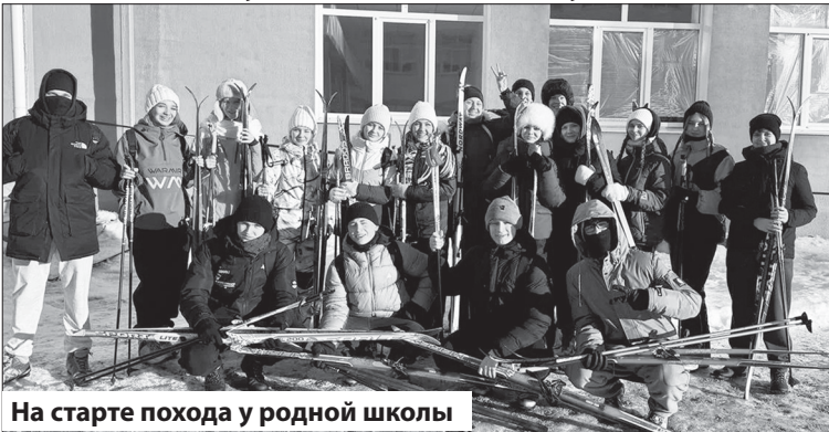
На старте похода у родной школы