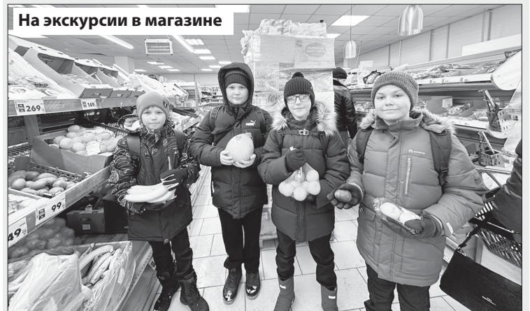
На экскурсии в магазине

С 9 по 13 февраля в нашей школе было особенно вкусно и познавательно. В эти дни проходила «Неделя здорового питания». Мероприятие было направлено на формирование правильных пищевых привычек и популяризацию сбалансированного рациона. Здоровое питание очень важно для хорошей и продуктивной работы мозга и хорошего настроения у школьников. Ребятам не только напомнили о том, как важно бережно относиться к своему здоровью и следить за питанием, школьники сами смогли принять активное участие в квест-играх, творческих конкурсах, кулинарном флешмобе и других мероприятиях.