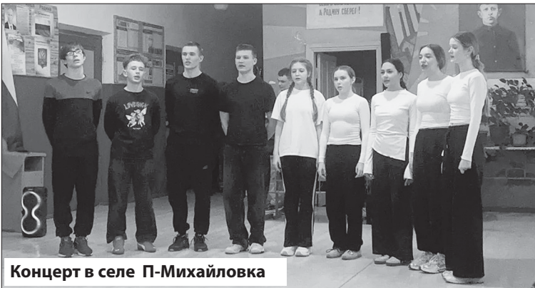
Концерт в селе П-Михайловка

Поход был очень увлекательным. Несмотря на расстояние и трудности, мы со всем справились. Очень тронуты теплым приемом во всех школах, где нас ждали подготовленные викторины и дискотеки. В школе села Перевесинки нас порадовали экскурсией по школьному музею. Так, что без дела не сидели. Я очень надеюсь, что в следующем году наш поход будет еще интереснее!